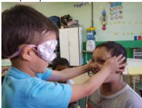
Figura 3 – Atividade de exploração sensorial

Essa atividade demonstrou que as crianças não têm medo do desconhecido, que explorar e mergulhar sem prejulgamento nas atividades rende frutos fantásticos, em relação ao autoconhecimento de si e conhecimento do outro. Sendo assim, a inclusão se dá de modo, imparcial, ou seja, todos incluídos, em busca de um fazer que mexe com o imaginário, pois ao escolher um colega, tocá-lo, senti-lo e imaginá-lo, tem a oportunidade de percebê-lo além da aparência.