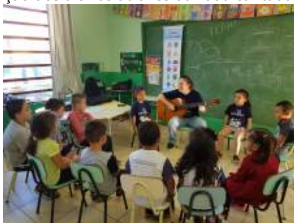
Figura 1 – Apresentação dos alunos através da roda cantada

Os alunos foram organizados em um grande círculo no centro da sala, e foram convidados a se apresentar através de uma canção cantada e tocada com o auxílio do violão pela professora. Os alunos um a um se apresentaram através de gestos no centro do círculo (Figura 1).