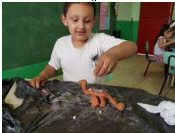
Figura 4 – Realização da atividade com argila e elementos da natureza

las em suas investigações, seja no espaço externo, sensibilizadas pelos diferentes elementos da natureza e a diversidade de formas possíveis de explorá-los. (Brasil, 2017)